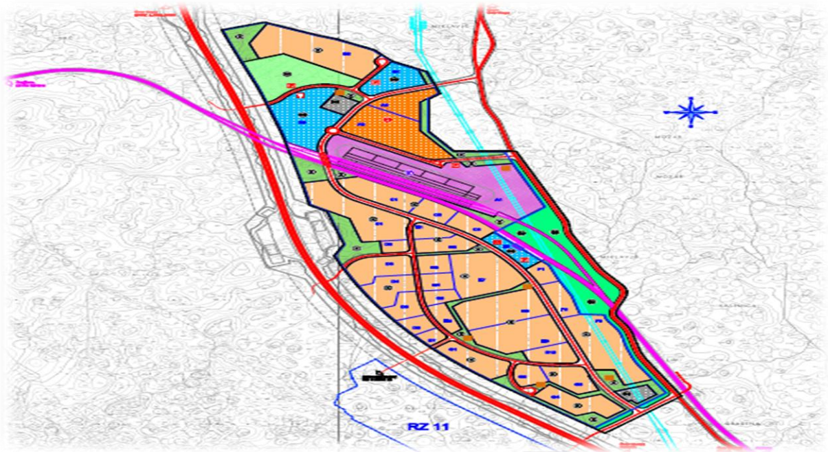
Urbanistički Plan uređenja 4 radne uzone RZ 12 Općina Matulji – Namjena i korištenje - MLC