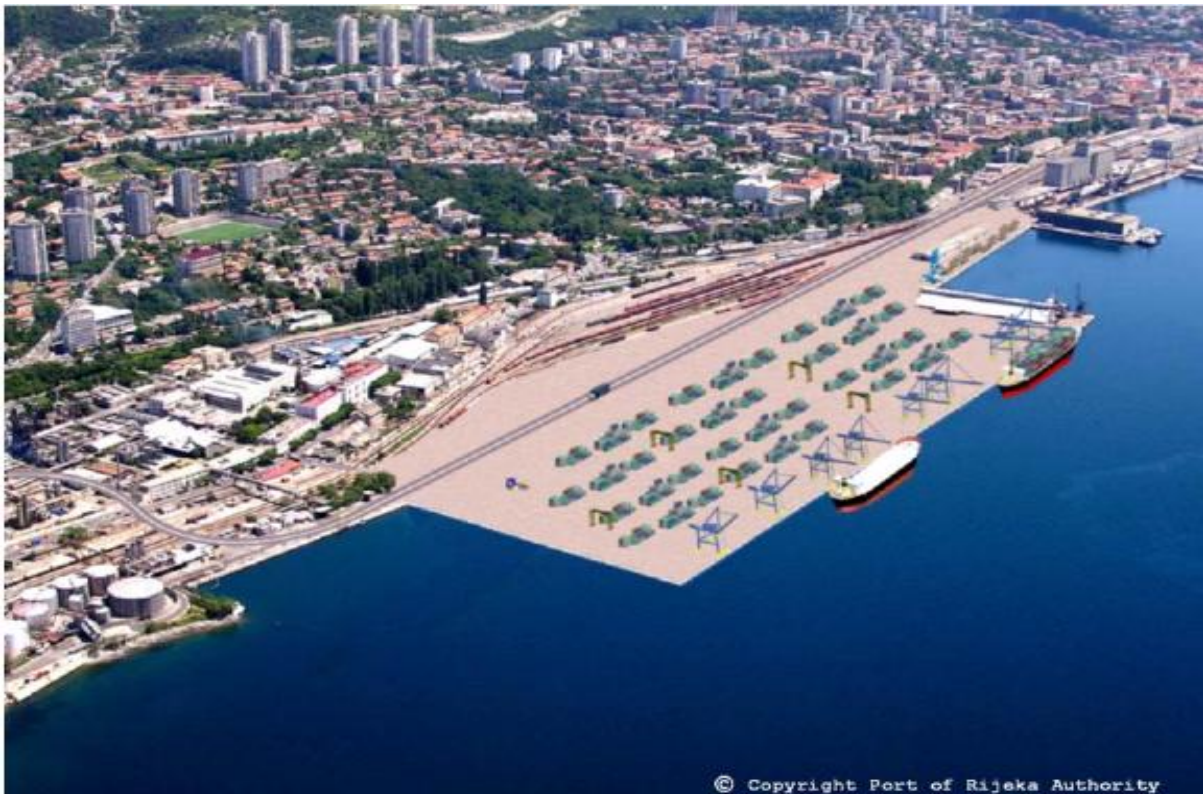
NEW ZAGREB PIER 700.000 TEU P/Y FUTURE DEVELOPMENT